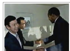
大統領の表敬（国営TVより）